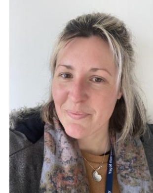
Miss H Roberts Mentor Blwyddyn

Cwblhewch y ffurflen opsiynau ar-lein ar: https://www.aberconwy.conwy.sch.uk/cy/options/ Dydd Gwener, Mawrth 22ain 2024